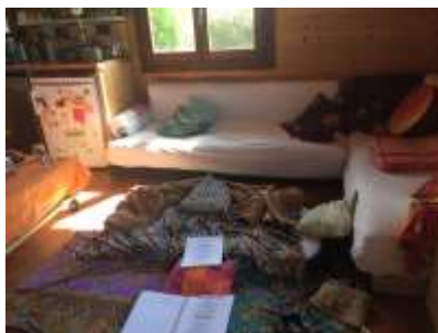
Atelier solo à domicile