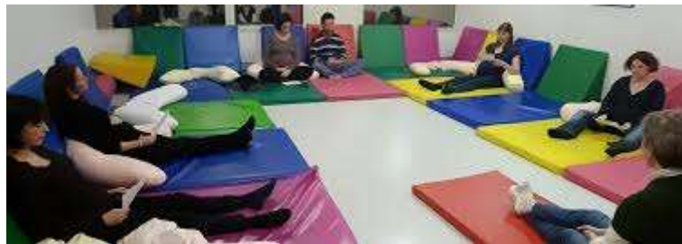
Exemple d'installation en salle - Atelier collectif